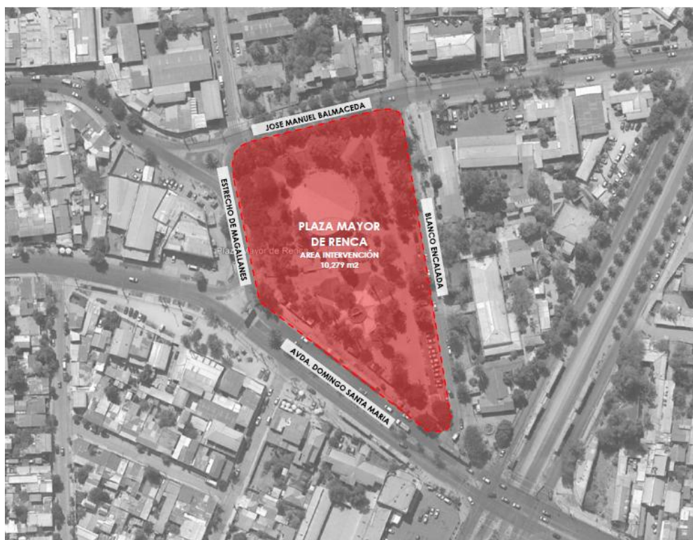
Imagen área de intervención plaza Mayor de Renca.

Se buscará mejorar las condiciones de habitabilidad del sector, a través de mejores espacios de encuentro y circulación, fortaleciendo así la identidad local y la calidad de vida de sus habitantes