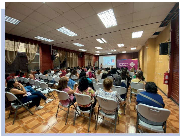
Capacitación Artículo 150 Protección al patrimonio de la mujer casada en sociedad conyugal, 2024.