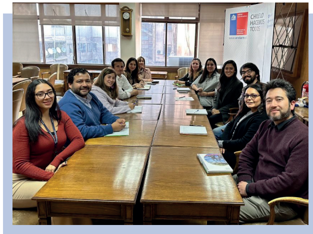
Comité de Género 2023