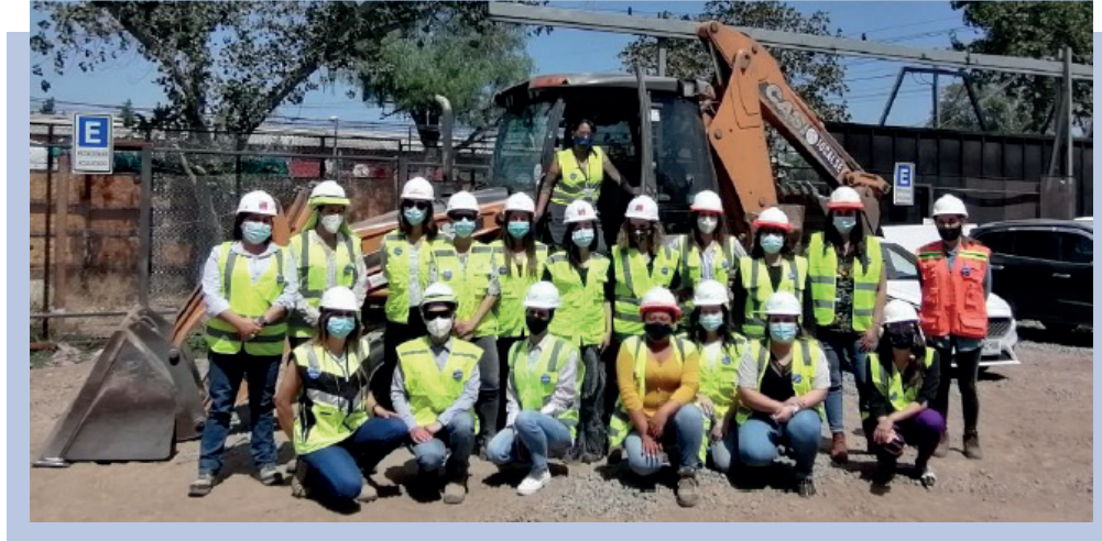
Mujeres trabajadoras en la obra Mapocho Río, 2020.